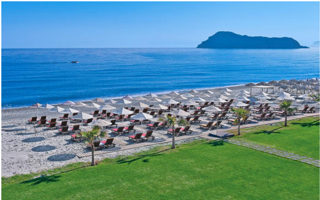
Minoa Palace Resort & Spa, Platanias, Kreta

Diagnostiskt Centrum för Bild- och Funktionsmedicin anordnar, i samarbete med Svensk Förening för Gastrointestinal Radiologi, åter en kurs i gastrointestinal radiologi på Kreta. Kursen riktar sig till radiologer med intresse för gastrointestinal radiologi, såväl specialist-kompetenta som ST-läkare i slutet av sin utbildning. Vi har god erfarenhet av att arrangera kursen på trivsamma Kreta. På Minoa Palace Resort & Spa finns en fin kongressanläggning reserverad för oss. Gästernas helhetsupplevelse värderas till höga 9,3 av 10,0 möjliga och hotellet har fått guldmedalj i "Customer Choice Award".